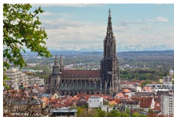
Blick auf der Ulmer Münster und die Alpenkette.