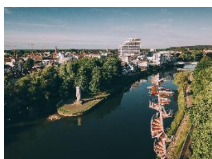
Nur für Schwindelfreie – der Berblinger Turm am Ulmer Donauufer.