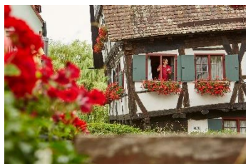
Das schiefe Haus im Ulmer Fischer- und Gerberviertel