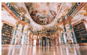
Der beeindruckende Bibliotheksaal im Kloster Wiblingen.