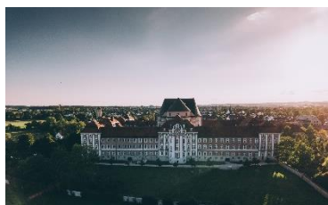
Das Kloster Wiblingen.